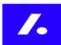
La Nouvelle Agency (Voseo...)